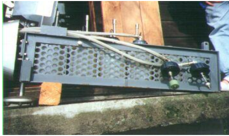
Obrázok 2 Lapák plavenín OTT-HEL.