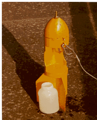
Obrázok 1 Lapák plavenín VÚVH.